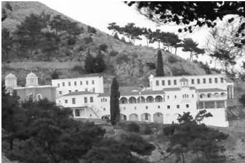
Η Μονή των Αγίων Πατέρων.

Η Μονή Αγίου Μάρκου βρίσκεται κοντά στο χωριό Καρυές και ιδρύθηκε το 1886 από τον ασκητή Παρθένιο. Η μονή βοήθησε σημαντικά