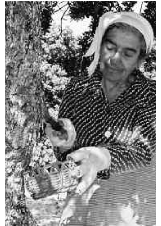
Συλλογή μικρών κομματιών

Ιατροφαρμακευτική χρήση: Η μαστίχα καταπολεμά το ελικοβακτήριο του Πυλωρού σύμφωνα με πρόσφατες μελέτες του πανεπιστημίου του Νότινγχαμ που δημοσιεύθηκαν στο έγκυρο ιατρικό περιοδικό The New England Journal of Medicine. Επίσης μελετάται από Πανεπιστήμια της Ελλάδας και του εξωτερικού η χρήση της μαστίχας στον ζαχαρώδη διαβήτη, στην χοληστερίνη και στα τριγλυκερίδια. Σημαντική είναι και η επίδραση της μαστίχας στη λειτουργία του ήπατος με την ενεργοποίηση της αποτοξινωτικής του δραστηριότητας. Σήμερα κυκλοφορούν στην αγορά σκόνη μαστίχας, κάψουλες μαστίχας και άλλα συναφή προϊόντα που χρησιμοποιούνται από πολύ κόσμο για την αντιμετώπιση των ανωτέρω ασθενειών. Η μαστίχα χρησιμοποιεί-