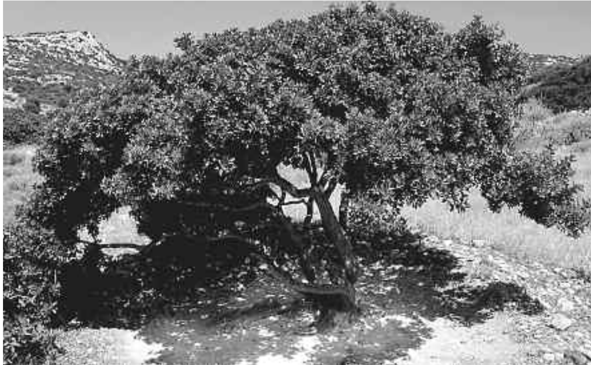
Το μαστιχόδενδρο μετά το ασπροχωμάτισμα.

Η μαστίχα της Χίου αναγνωρίστηκε από τα αρχαία χρόνια, τόσο για το ιδιαίτερο άρωμά της, όσο και για τις θεραπευτικές της ιδιότητες. Έχει καταγραφεί ως η πρώτη φυσική τοίχλα του αρχαίου κόσμου, που χρησιμοποιούνταν για τον καθαρισμό των δοντιών και τη φρεσκάδα της αναπνοής. Την χρησιμοποιούσαν