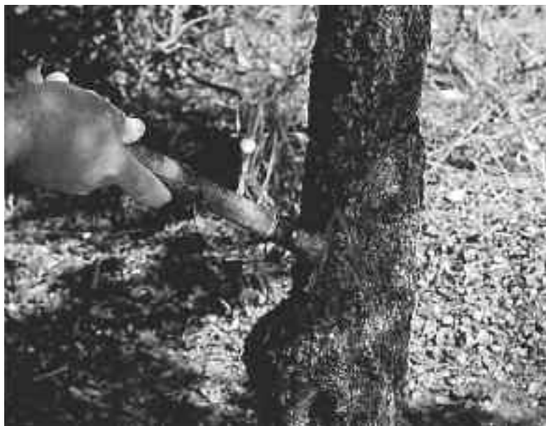
Το κέντημα των σκίνων

Το δεύτερο μάζεμα γίνεται μετά τις 15 Σεπτεμβρίου οπότε και συλλέγονται όλα τα δάκρυα από τον κορμό του μαστιχόδενδρου και από το έδαφος. Κατά το δεύτερο μάζεμα συλλέγονται από το «τραπέζι» οι χοντρές σταγόνες μαστίχας και την υπόλοιπη μαστίχα την σκουπίζουν και την βάζουν σε τσουβάλια. Τελευταίες μαζεύουν τις σταγόνες που έχουν μείνει στα κλαδιά και τον κορμό του δένδρου. Τις λένε δακτυλιδόπετρες, δάκρυα και φλισκάρια. Η συγκομιδή μεταφέρεται στη συνέχεια σε δροσερές αποθήκες ώστε