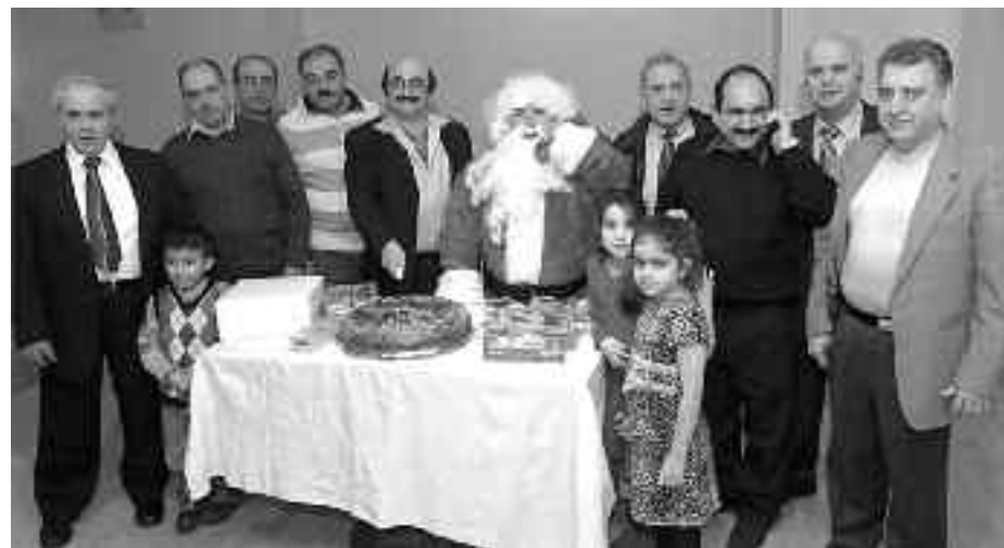
Πιστοί στην παράδοση, τα μέλη του Συλλόγου Ελατουσίων Χίου, κόβουν τη βασιλόπιτα και εύχονται για υγεία και πρόοδο της οργάνωσής τους.