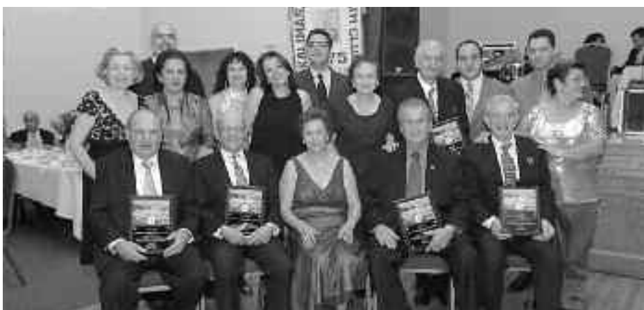
Στελέχη του Συλλόγου Καλλιμασιωτών Αμερικής σε εκδήλωση με επιδόσεις τιμητικών διακρίσεων σε άξιους συμπατριώτες τους.