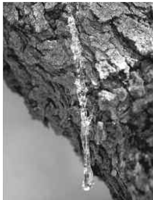
Το «πληγόμενο» δέντρο ...δακρύζει το πολύτιμο... δάκρυ του.