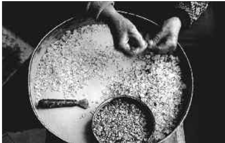
Το δύσκολο καθάρισμα.

Το μαστιχέλαιο χρησιμοποιείται τόσο ως άρωμα όσο και ως σταθεροποιητής αρώματος. Στην υφαντουργία και βαμβακοργία χρησιμοποιείται ως σταθεροποιητής χρωμάτων για το κολλάρισμα των υφασμάτων και ειδικά των μεταξωτών. Στη βυρσοδεψία, στην παραγωγή ελαστικών και πλαστικών, στην παραγωγή χρωμάτων, κόλλας και κολλοειδών ουσιών, στην παραγωγή καμφοράς και στην λιθογραφία ως σταθεροποιητής χρωμάτων. Επίσης, χρησιμοποιείται στην κατασκευή βερνικιών υψηλής ποιότητας, όπως βερνίκια αεροσκαφών, μουσικών οργάνων, επίπλων κ.τ.λ και στην παρασκευή ισπαν. κηρού (βουλοκέρι).