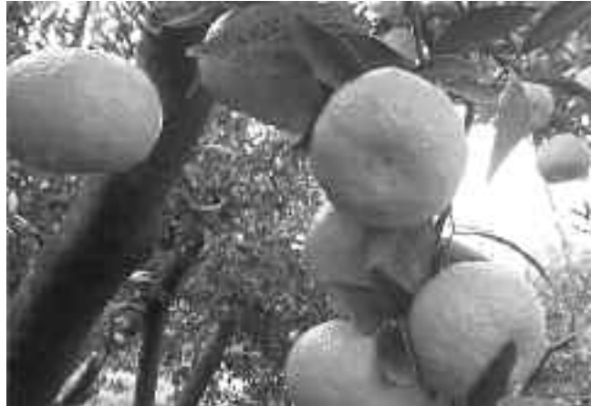
Τα χιώτικα μανταρινία, γνωστά για τη γεύση τους.

Γνωστή από την αρχαιότητα για την εξαιρετική ποιότητα των προϊόντων της, η Χίος παράγει άφθονα και ποικίλα φρούτα εποχής. Το σταφύλι και τα σύκα υπήρξαν η βάση αυτής της ποικιλίας, στα οποία προστέθηκαν σταδιακά τα αμύγδαλα, τα φιστίκια, τα καρύδια, τα μήλα, τα κυδώνια, τα βύσσινα, τα κεράσια και, τελευταία, τα εσπεριδοειδή, δηλαδή τα νεράντζα, τα περίφημα χιώτικα μανταρινία, τα πορτοκάλια, τα περγαμόντα, τα κίτρα