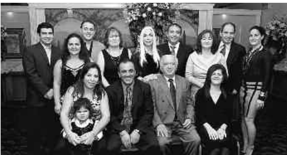
Στιγμιότυπο από το βραδιά χορού του Συλλόγου Βικίου Χίου, «Κοίμηση της Θεοτόκου». Οι Χιώτες βρίσκουν πάντα την ευκαιρία να συνδιασκεδάσουν, να συζητούν για τις οργανώσεις τους και να θυμούνται το νησί τους.