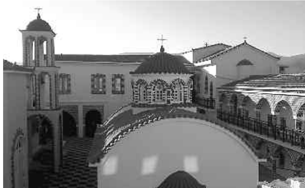
Η Μονή του Αγίου Κωνσταντίνου που είναι αυστηρά γυναικείο.

Η Μονή Αγίου Γεωργίου βρίσκεται στο χωριό Πυργί και ιδρύθηκε το 19ο αιώνα. Χαρακτηριστικό της μονής είναι τα παραδοσιακά «ξυστά»