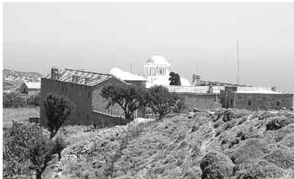
Η Μονή Κοιμήσεως Θεοτόκου Ψαρών.