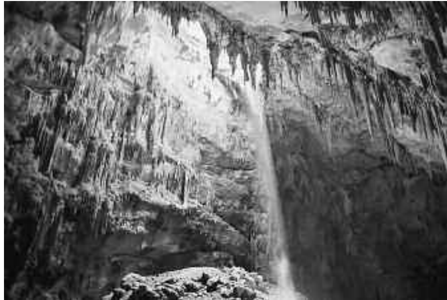
Το Σπήλαιο Ολύμπων

πων (Συκιάς) έχει μέγιστο βάθος 57 μέτρο, σε υψόμετρο 100 περίπου μέτρων από την επιφάνεια της θάλασσας. Ο κεντρικός του θάλαμος έχει μέγιστες διαστάσεις 40Χ40. Η αρχή της δημιουργίας του τοποθετείται στο Ανώτερο Ιουρασικό (πριν 150 εκατομμύρια χρόνια) ενώ η ολοκλήρωση τους κατά το Κενοζωικό (πριν 50 εκατομμύρια χρόνια). Ο ασβεστικός του διάκοσμος βρίσκεται ακόμη σε κατάσταση δημιουργίας. Οι σταλακτίτες και οι σταλαγμίτες του σπηλαίου δημιουργούνται από την χημική απόθεση του ανθρακικού ασβεστίου που μεταφέρεται από το νερό που εισέρχεται στο σπήλαιο από τη βροχή. Η σταγονορροή στο σπήλαιο είναι έντονη σε περιόδους βροχόπτωσης. Η υγρασία του σπηλαίου κυμαίνεται περίπου στο 95% και η θερμοκρασία του περίπου στους 18° C.