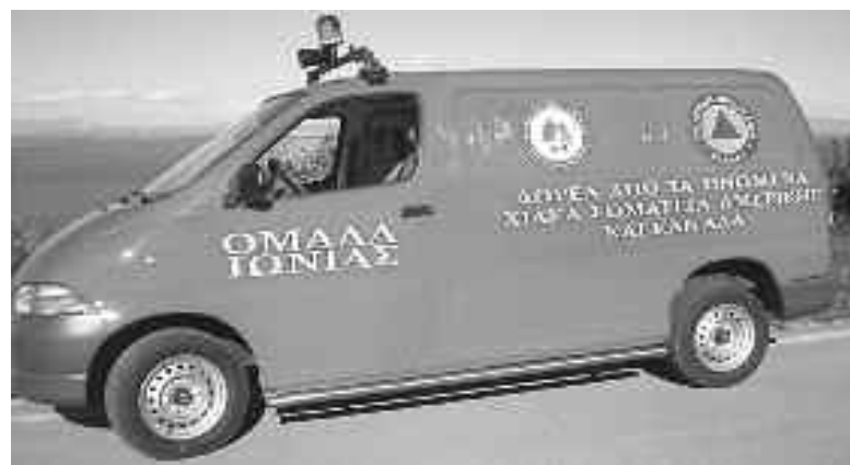
Το αυτοκίνητο για τις ανάγκες της Πυροσβεστικής που δώρισαν οι Χιώτες της Αμερικής στο νησί τους.

χρήματα διατίθενται για φιλανθρωπικούς σκοπούς, αφού το φθισιατρείο δεν χρειάζεται να γίνει. Το 1962 γιορτάζονται τα 50 χρόνια από την ίδρυση του «Κοραή» και τα κέρδη της γιορτής διατίθενται για την ενίσχυση του έργου της Φιλοδοσικής Χίου. Το καλοκαίρι του 1969 οργανώνεται το Α' συνέδριο των Ηνωμένων Χιακών Σωματείων Αμερικής στη Χίο. Τον Οκτώβριο του 1971 ο «Κοραής» αναγνωρίζεται από την Αμερικανική εφορία ως φιλανθρωπικός οργανισμός με δι-