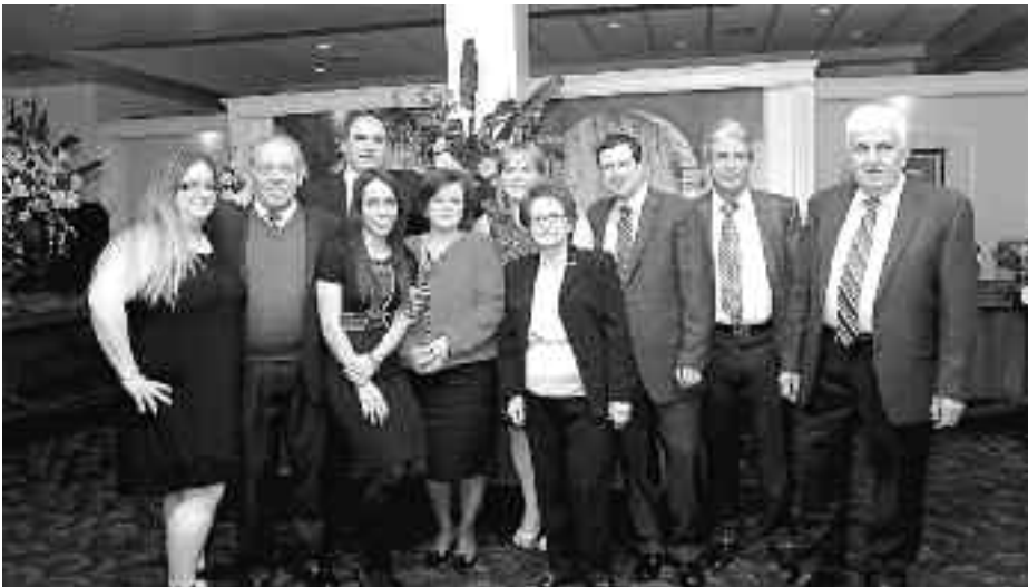
Από τη φετινή χοροεσπερίδα του Συλλόγου Αφροδισιανών, «Αγιος Μάμας», Χίου στη Ν. Υόρκη. Ο Σύλλογος είναι γνωστός από την προσήλωσή του στις τοπικές παραδόσεις.