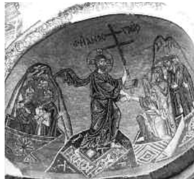
Ανάσταση, ψηφιδωτό στη Νέα Μονή.

ο Μονομάχος ήταν εξόριστος στη Μυτιλήνη, άκουσε την προφητεία των μοναχών της Παλαιάς Μονής που μιλούσε για την άνοδο του στο θρόνο της Κωνσταντινούπολης. Υποσχέθηκε λοιπόν ότι αν πραγματοποιούνταν το όραμα τους θα φρόντιζε την ανέγερση μεγαλοπρεπούς ναού. Για να θυμάται την υπόσχεσή του οι μοναχοί ζήτησαν και πήραν