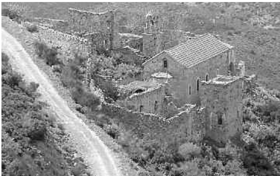
Η Μονή Μουνδών