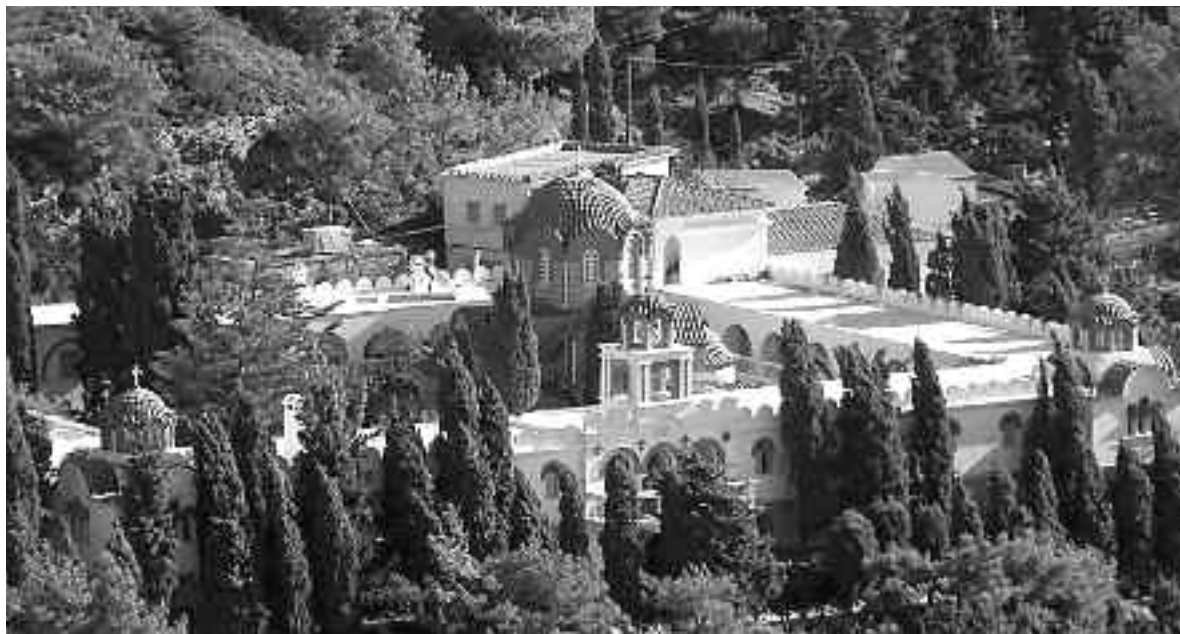
Η Μονή του Ευαγγελισμού Θεοτόκου.

Στις Οinouσες και στην πλευρά του νησιού που βλέπει στη Χίο, πάνω από μια νοτιοδυτική γραφική παραλία όπου ανοίγεται ο ορμίσκος Τσελεπί, βρίσκεται η Ιερή Μονή του Ευαγγελισμού της Θεοτόκου. Το μοναστήρι χτίστηκε από το ευσεβές ζευγάρι του Πανάγου και της Κατίγκως Πατέρα. Εγκαινιάστηκε τη 10η Αυγούστου του 1965 και εορτάζει δύο φορές το χρόνο, στις 25