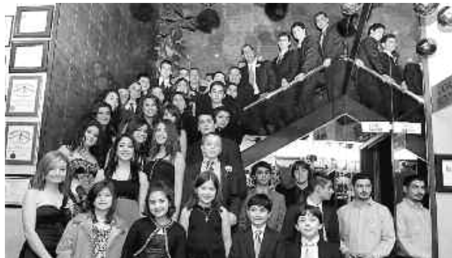
Η νέα γενιά των Δαφνουσίων Αμερικής σε αναμνηστική φωτογραφία από χοροεσπερίδα του συλλόγου τους στα σκαλιά του «Ρεξ Μάνορ» στο Μπρούκλιν.