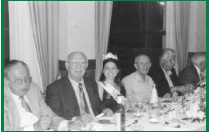
Αναμνηστική φωτογραφία από το δείπνο προς τιμή της «Μις Χιός 2005» που παρέθεσε ο Παγκιακός «Κοραής» στο ξενοδοχείο Χανδρής το περασμένο καλοκαίρι στη Χίο

Από το βιβλίο «Είντα γίνεται στη Χίο» Γ. Κρόκου