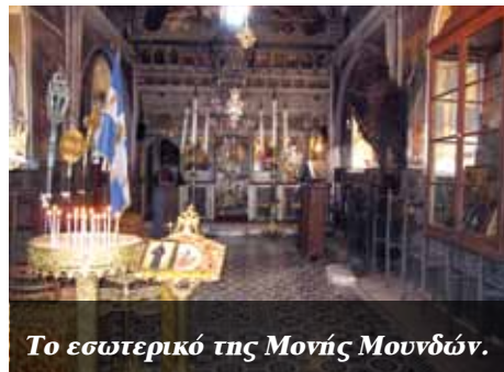
Το εσωτερικό της Μονής Μουνδών.

τοιχογραφίες, μοναδικές στο είδος τους στον αιγαιοπελαγίτικο χώρο, καλύπτουν σήμερα τους τοίχους του καθολικού και είναι έργο ανώνυμου ζωγράφου, του 1849. Διακρίνονται για τη λαϊκή μεταβυζαντινή τεχνοτροπία τους με την ελα-