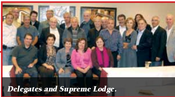
Delegates and Supreme Lodge.

The Chios Society of New Jersey joined the CSAC and will host the 59th National Chian Convention in Atlantic City at the Trump Taj Mahal on September 20-22, 2013.