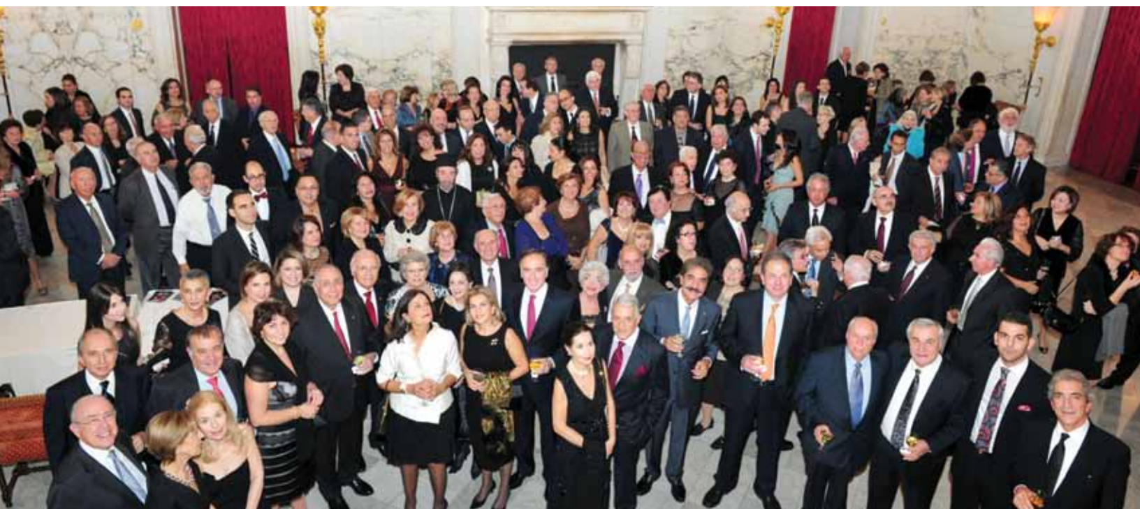
Παγκιακός Σύλλογος «Κοραις» Ν.Υ.: 10 Νοεμβρίου 2012, Metropolitan Club στο Μανχάταν.