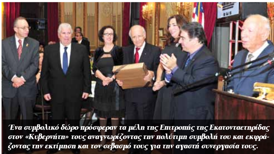
Ένα συμβολικό δώρο πρόσφεραν τα μέλη της Επιτροπής της Εκατονταετηρίδας στον «Κυβερνήτη» τους αναγνωρίζοντας την πολύτιμη συμβολή του και εκφράζοντας την εκτίμησή και τον σεβασμό τους για την αγαστή συνεργασία τους.

Ομογένεια και την πατρίδα και τόνισε πως ο εορτασμός αποτελεί φόρο τιμής «στους μετανάστες που έγιναν τα θεμέλια πάνω στα οποία ξαναχτίστηκε η Μεγάλη Ελλάδα έξω από την Ελλάδα.»