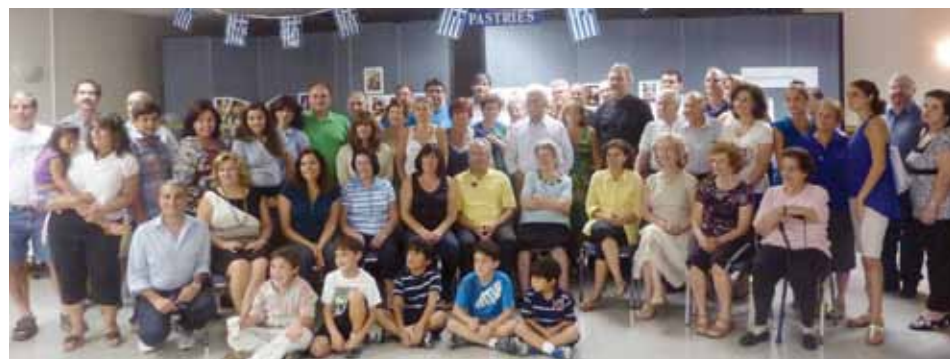
Picnic: St Theodore, Lanham, MD, September 2012

Address: 9329 Reach Road, Potomac, MD 20854; Internet: www.chios-society.org